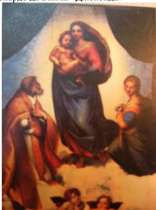
Рафаэль Санти «Сикстинская Мадонна»