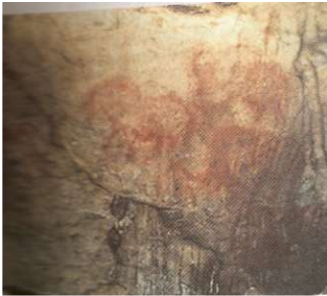
Первобытная живопись в пещере Шульганташ