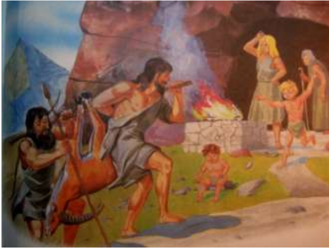
Первобытные люди жили в пещерах