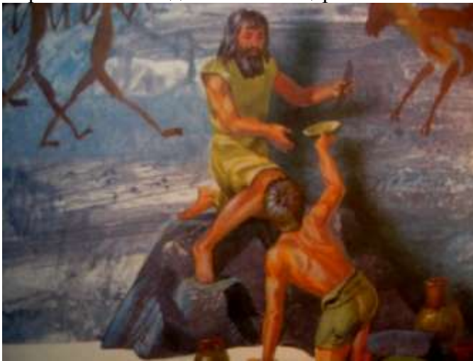
Они научились рисовать прежде чем писать.