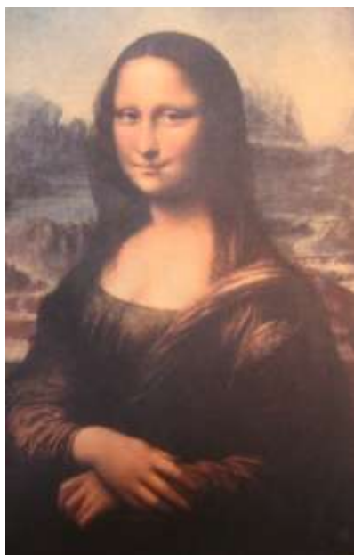
Леонардо да Винчи «Джоконда»