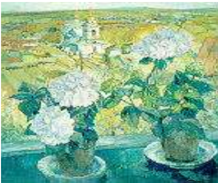
Тюлькин А.Э. «Гортензии»