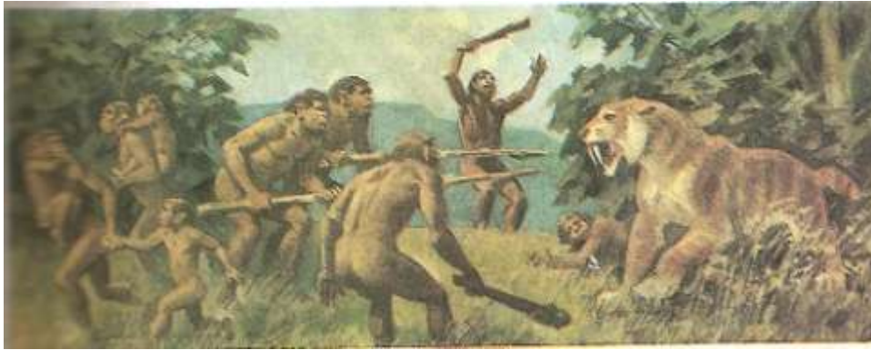
Первобытные люди на охоте