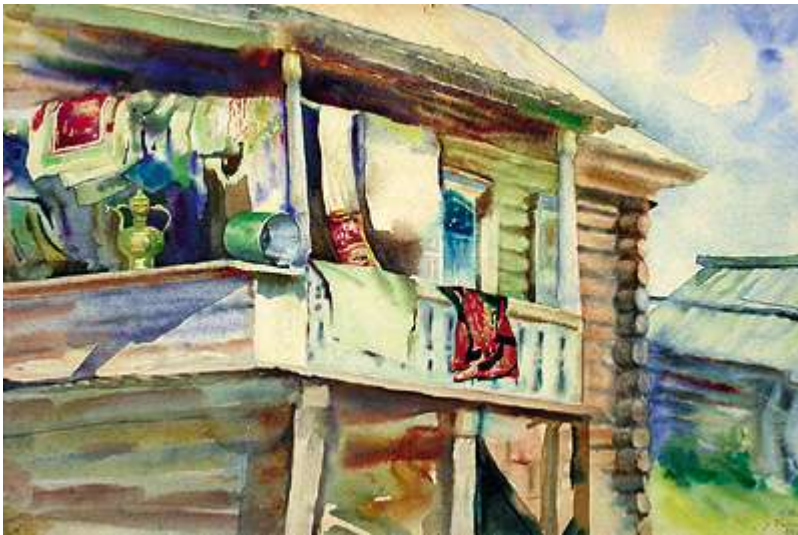
Давлеткильдеев «Крыльцо башкирского дома»